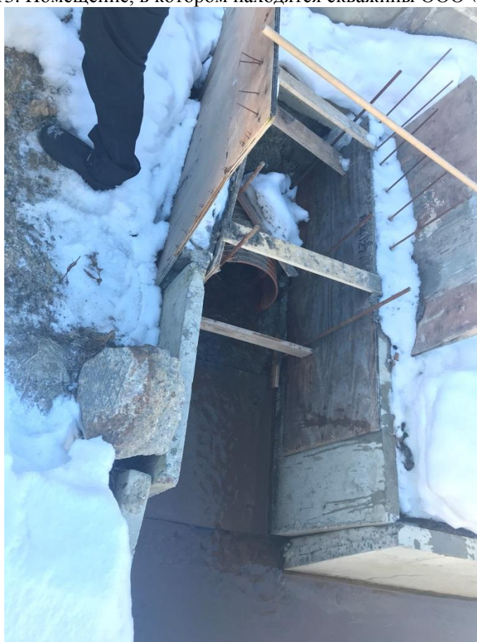
Фото 14. Выпуск сточных вод в железобетонный лоток после локальных очистных сооружений ООО «ОМХ»