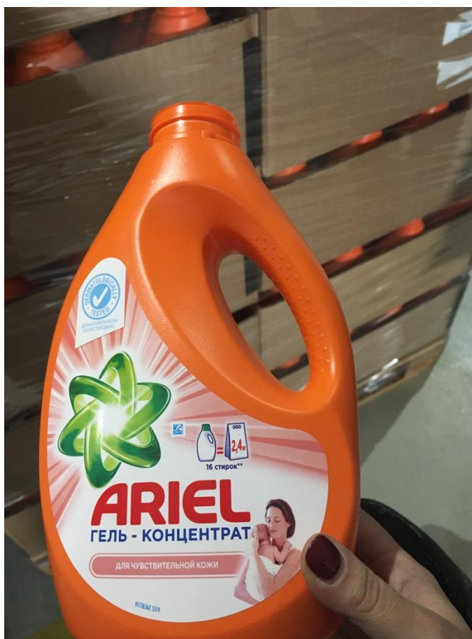
Фото 12. Тара пластиковая предположительно используемая для разлива продукции