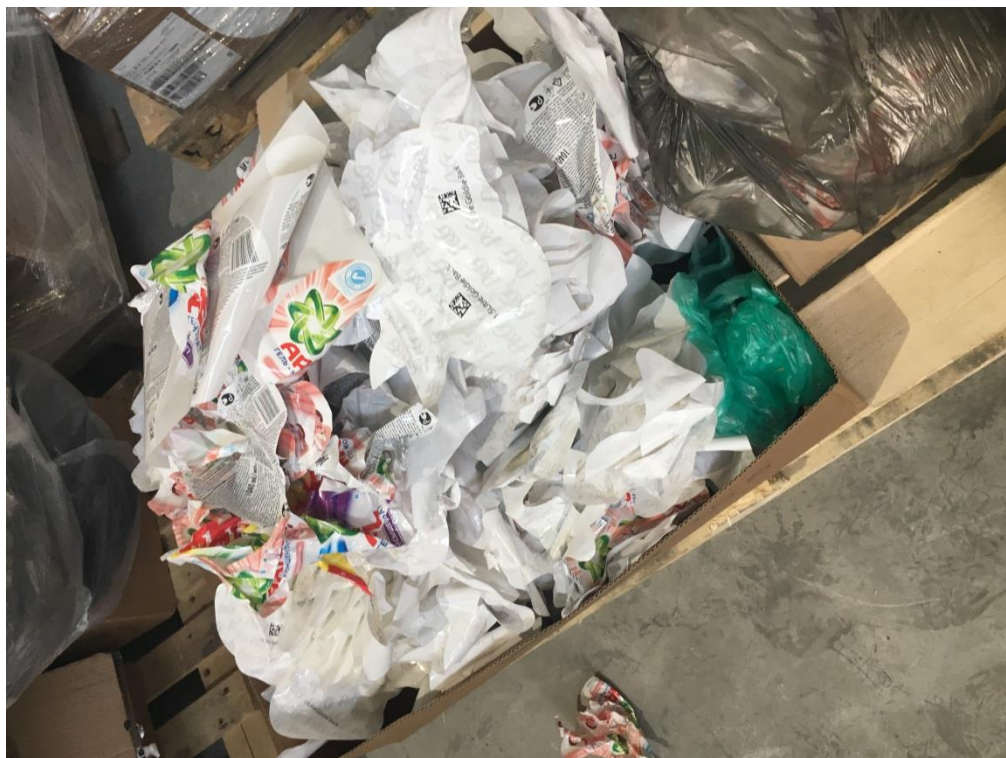
Фото 11. Этикетки, утратившие потребительские свойства

свойства, и тара пластиковая, предположительно используемая для разлива продукции.